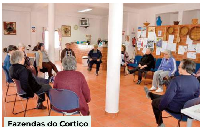
Fazendas do Cortiço