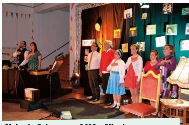
Ciclo da Primavera 2018 - Silveiras