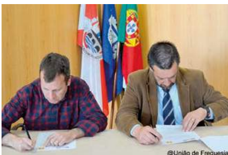
Protocolo com a Associação Saber Crescer