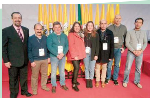
XVI Congresso da ANAFRE