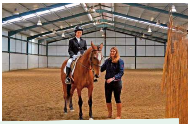
Poule de Ensino - Centro Hípico D. Duarte