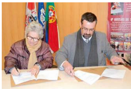
Protocolo com o Clube de Ténis de Montemor-o-Novo

diferentes Associações. Tais protocolos têm vindo a permitir, não só dar resposta a algumas competências transferidas para a Junta de Freguesia pelo Município de Montemor-o-Novo, mas também para fazer face às importantes atividades levadas a cabo pelas Associações.