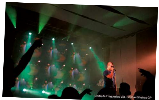
União de Freguesias Vila, Bispo e Silveiras GP