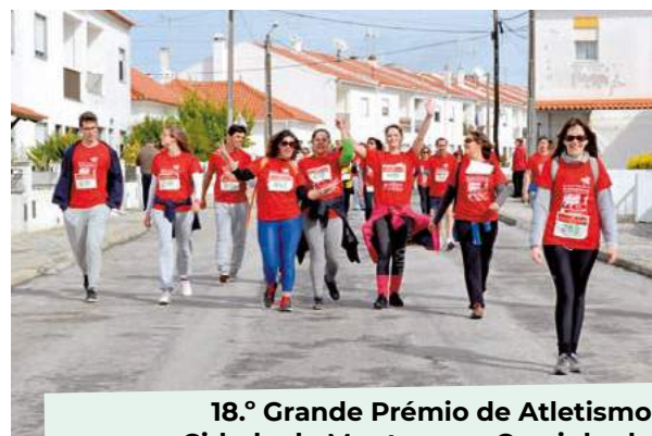
18.º Grande Prémio de Atletismo Cidade de Montemor - Caminhada