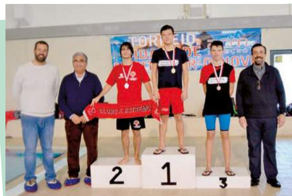
V Torneio de Natação ACM