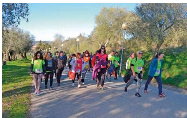
2.ª Corrida Montemor Solidário - Caminhada