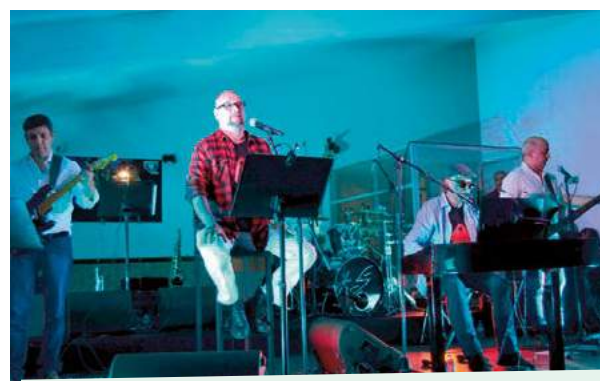
Ciclo da Primavera 2018 - CHE A Alentejana