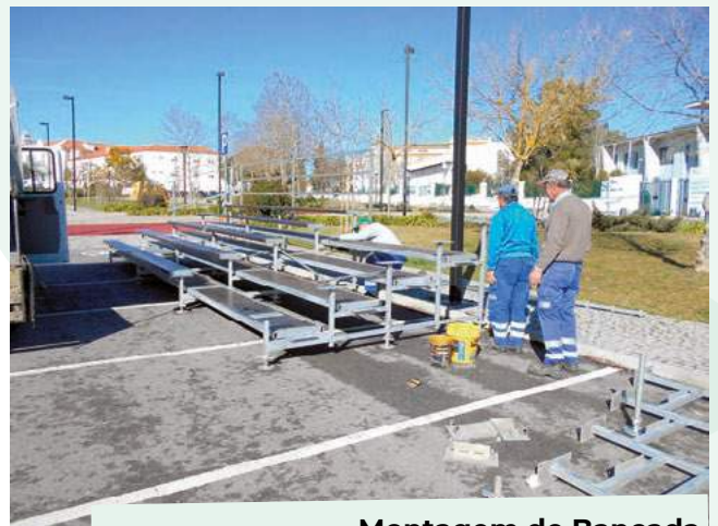
Montagem de Bancada