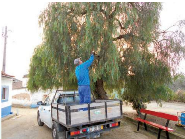
Limpezas e desmatações no Paião