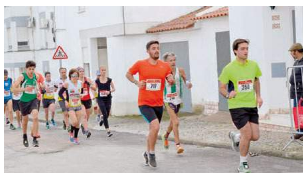
18.º Grande Prémio de Atletismo Cidade de Montemor