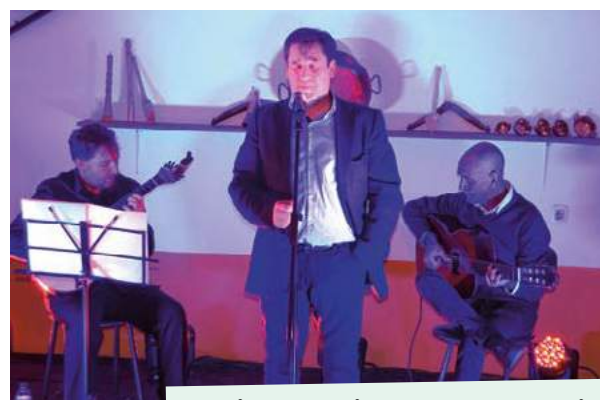
Ciclo da Primavera 2018 - Maia