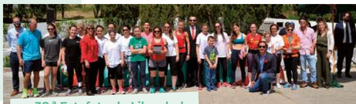
38.ª Estafeta da Liberdade Equipa Feminina Bombeiros