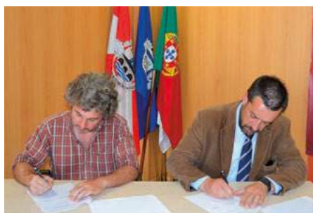
Protocolo com a Associação O Girassol