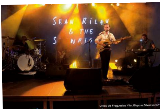
União de Freguesias Vila, Bispo e Silveiras GP