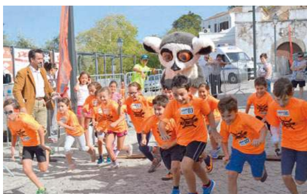
V Run Castle - Mini Run Castle