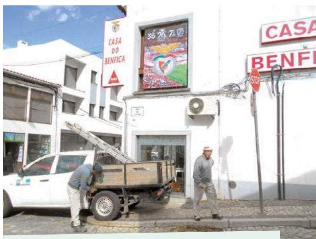
Colocação de faixa na casa do Benfica de Montemor