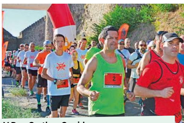
V Run Castle - Corrida