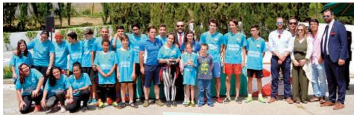
38.ª Estafeta da Liberdade Almansor Futebol Clube

Apoio em diversas iniciativas, nomeadamente: Grande Prémio de Atletismo, Estafeta da Liberdade, Folclore, Ténis, Futsal, Ciclismo, Encontro de Automóveis, Festival Jovem e apoio à edição de livros, Jogos do Município e Ciclo da Primavera, Run Castle, entre as muitas iniciativas levadas a cabo pelo Movimento Associativo.