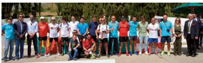
38.ª Estafeta da Liberdade Equipa B Bombeiros