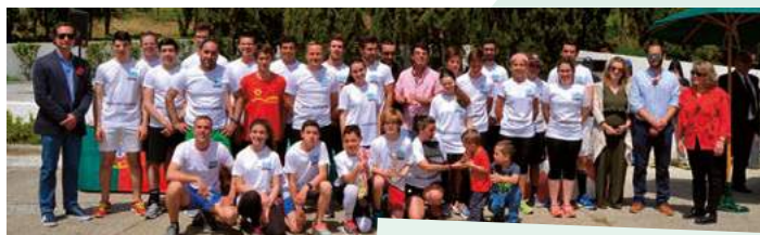
38.ª Estafeta da Liberdade Silveiras