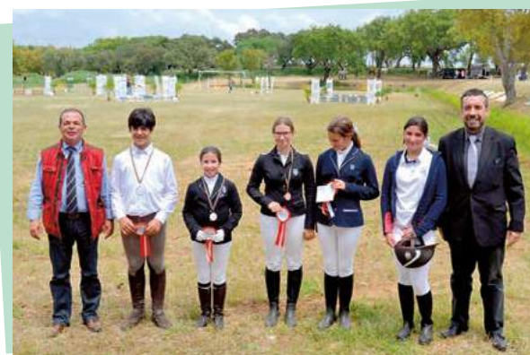
Prova de Obstáculos "2.º Troféu Distrito de Évora" - Equimor