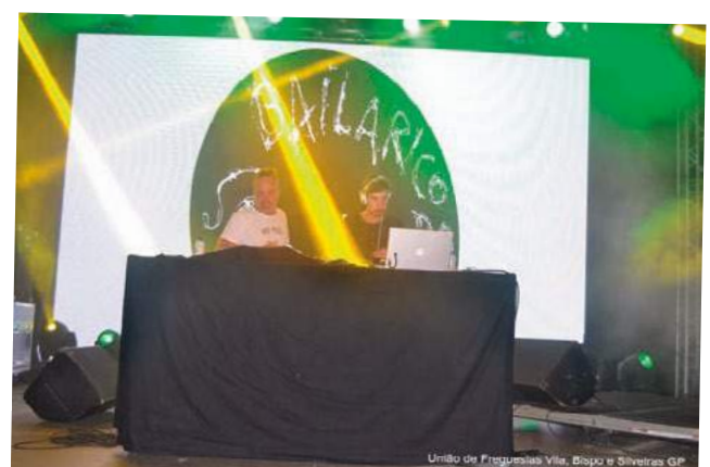
União de Freguesias Vila, Bispo e Silveiras GP