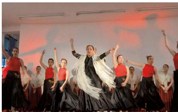
Ciclo da Primavera 2018 - Silveiras