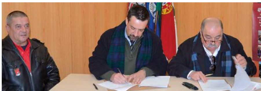
Protocolo com a Associação Humanitária dos Bombeiros Voluntários de Montemor-o-Novo