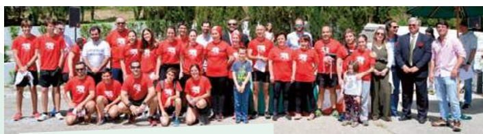
38.ª Estafeta da Liberdade Atlético Clube de Montemor