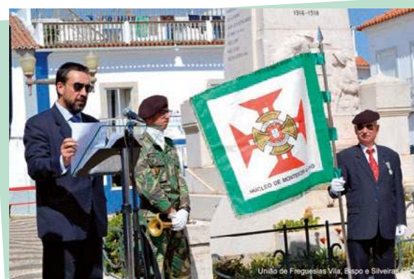
Aniversário da Liga dos Combatentes Núcleo de Montemor