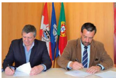
Protocolo com o Rugby Club de Montemor