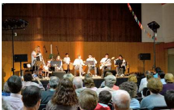
Ciclo da Primavera 2018 - São Geraldo