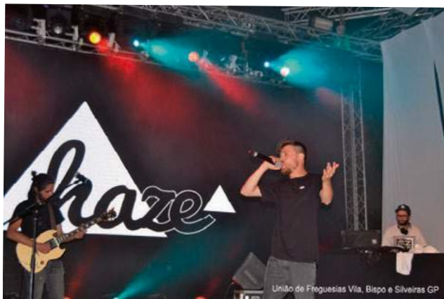
União de Freguesias Vila, Bispo e Silveiras GP

Foram dois dias de música, desporto, arte, mercado, performances, palestras e exposição. No festival estiveram presentes Haze, Domi, ProfJan, Performance Sons e Factos, Companhia Saguim, Sean Riley & The Slowriders, Bailarico Sofisticado e After Hours no Musicafé.