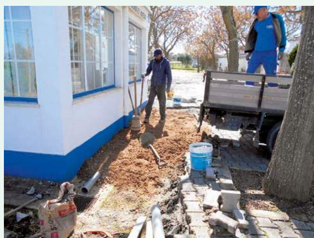
Arranjos exteriores no Centro Cultural de Reguengo / São Mateus