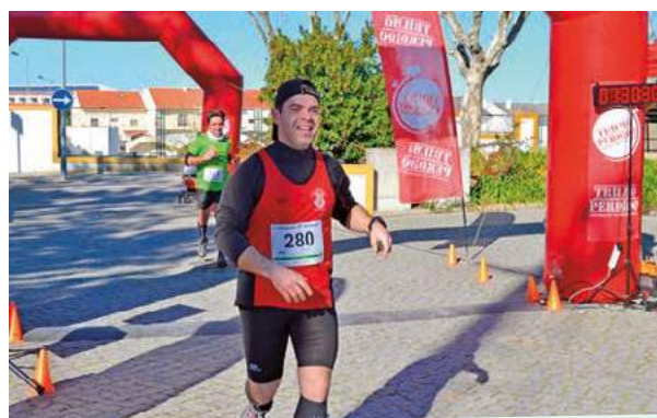
2.ª Corrida Montemor Solidário - Corrida