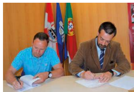
Protocolo com a Associação Solidariedade das Silveiras