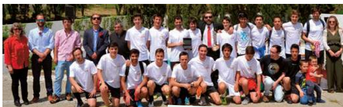
38.ª Estafeta da Liberdade Reguengo / São Mateus