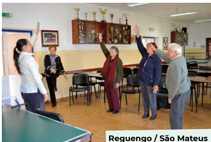
Reguengo / São Mateus