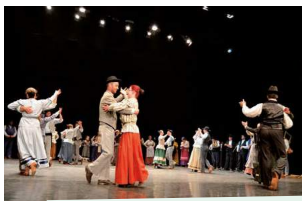
Prova de Obstáculos "2.º Troféu Distrito de Évora" - Equimor