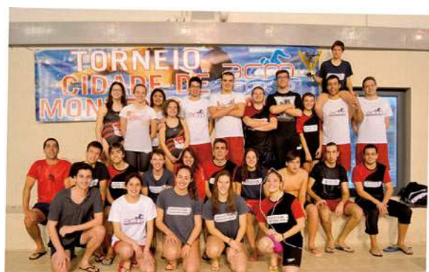
V Torneio de Natação ACM