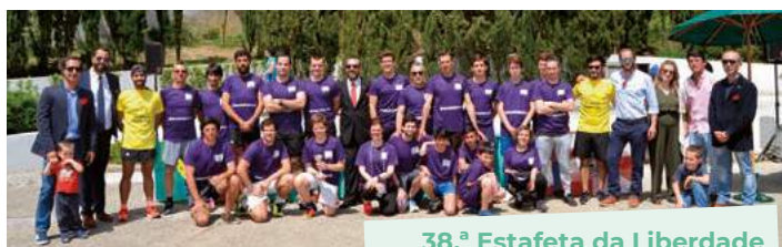
38.ª Estafeta da Liberdade São Geraldo