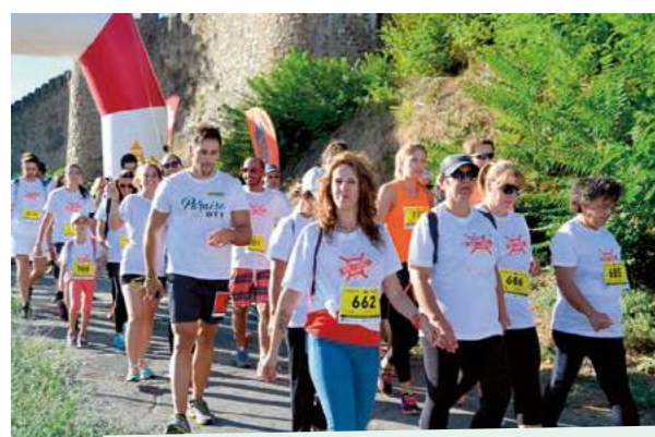
V Run Castle - Caminhada