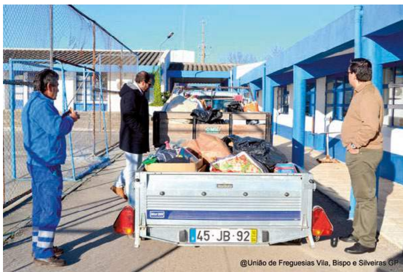
@União de Freguesias Vila, Bispo e Silveiras GP