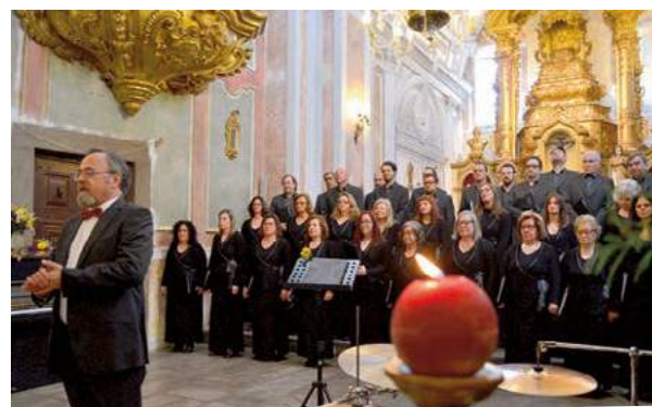
31.º Aniversário do Coral de São Domingos