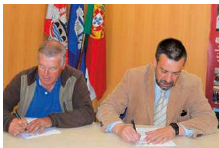
Protocolo com o Clube de Tiro e Caça de Santa Sofia