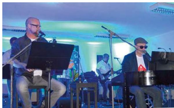
Ciclo da Primavera 2018 - Reguengo/São Mateus