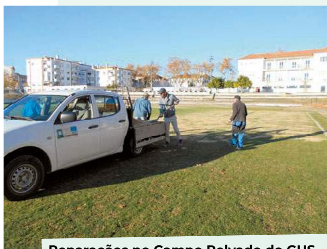
Reparações no Campo Relvado do GUS