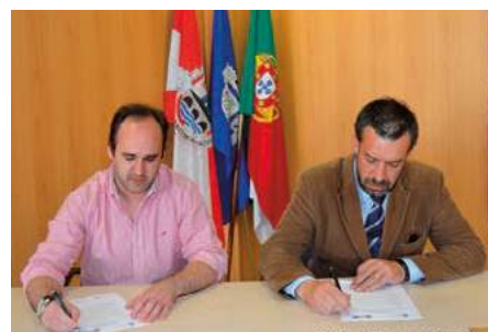
Protocolo com o Hospital de São João de Deus