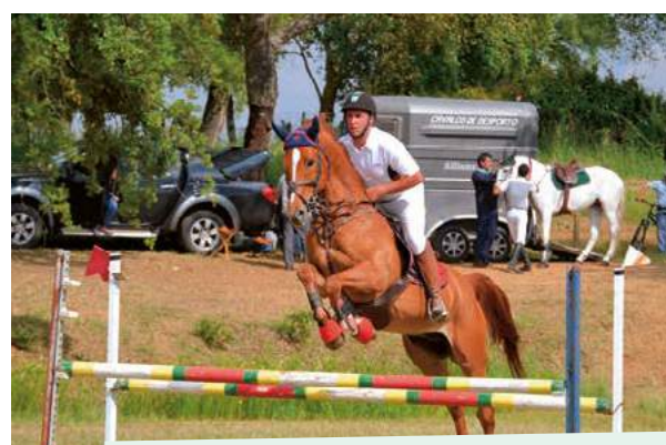
Prova de Obstáculos "2.º Troféu Distrito de Évora" - Equimor