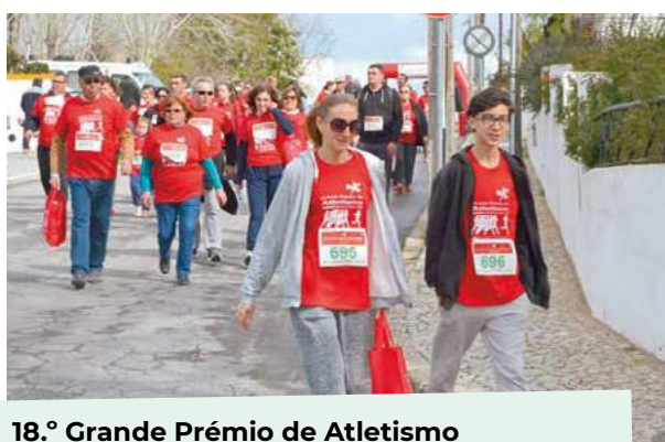
18.º Grande Prémio de Atletismo Cidade de Montemor - Caminhada