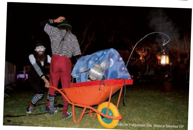
União de Freguesias Vila, Bispo e Silveiras GP