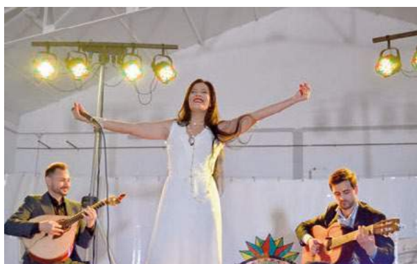
Ciclo da Primavera 2018 - Fazendas do Cortiço