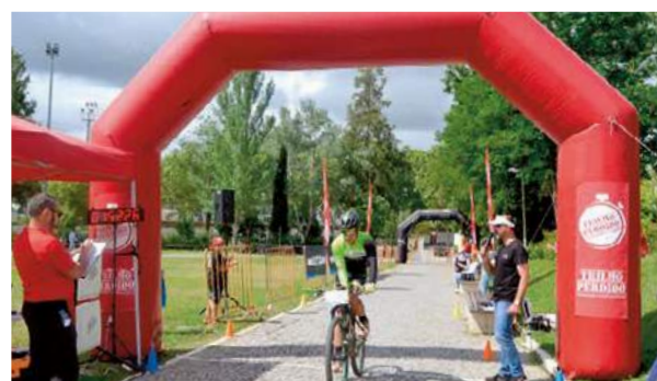
10.ª Maratona BTT Cidade de Montemor