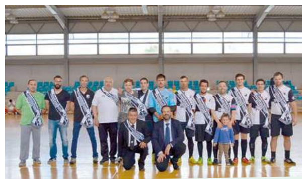
GUS Campeões Distritais de Futsal Sénior 17/18