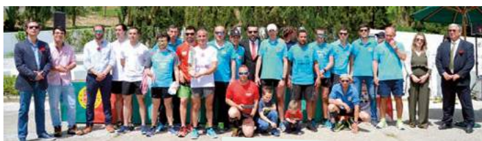
38.ª Estafeta da Liberdade Equipa A Bombeiros