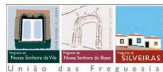
Tabela de Taxas e Licenças 2018