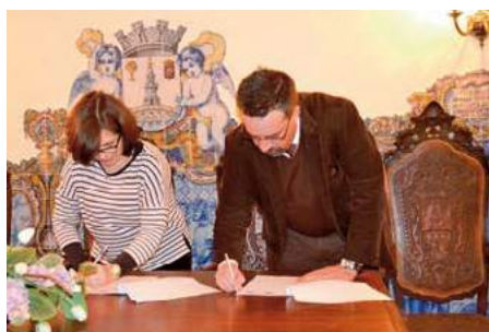
Assinatura de contrato Interadministrativo entre o Município de Montemor-o-Novo e a União de Freguesias Vila, Bispo e Silveiras