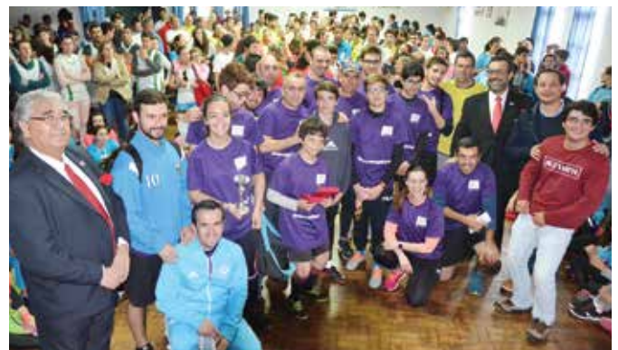
39ª ESTAFETA DA LIBERDADE | SÃO GERALDO