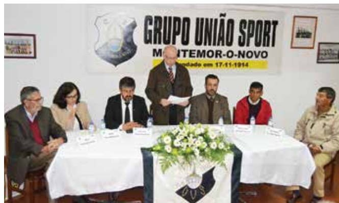
104º ANIVERSÁRIO DO GRUPO UNIÃO SPORT