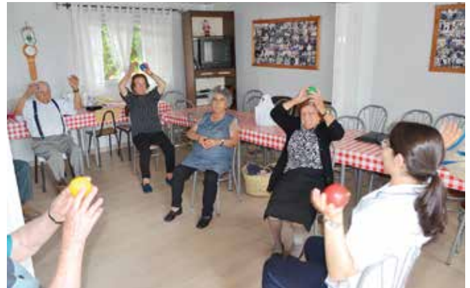
➤ ARPI DOS CAVALEIROS

Continuação do projeto "Idosos em Movimento". Esta iniciativa prende-se com a realização de uma sessão semanal de classe de mobilidade, um workshop e um rastreio (glicémia, tensão arterial), junto dos utentes residentes na Freguesia de N.ª Sra. da Vila, N.ª Sra. do Bispo e Silveiras (Maia, reguengo/São Mateus, Cavaleiros, Montemor-o-Novo, Fazendas do Cortiço, São Geraldo e Silveiras) com as Fisioterapeutas do Hospital São João de Deus, numa parceria com o Instituto de São João de Deus/ Hospital de São João de Deus. As sessões têm a duração de 60 minutos. Todas as atividades têm o intuito de combater, não só, a solidão dos idosos através do convívio, mas também, de promover a saúde, o envelhecimento ativo, através de atividades de mobilidade e ações de formação sobre os mais diversificados temas.