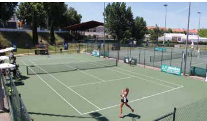
➤ 15ª EDIÇÃO DO TORNEIO INTERNACIONAL DE TÊNIS MONTEMOR LADIES OPEN