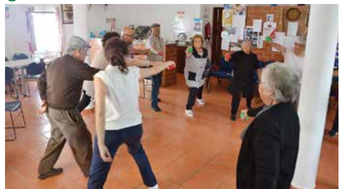
➤ ARPI DAS FAZENDAS DO CORTIÇO