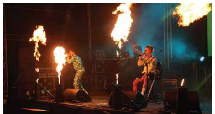
SUPA SQUAD