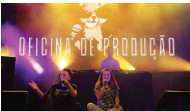
OFICINA DE PRODUÇÃO