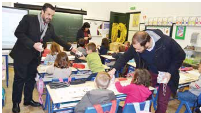
DISTRIBUIÇÃO DE LEMBRANÇAS DE NATAL PELAS ESCOLAS DA FREGUESIA