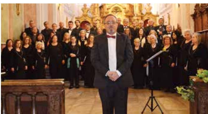
32º ANIVERSÁRIO DO CORAL DE SÃO DOMINGOS