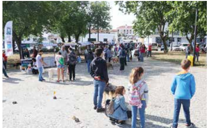
CÃOMINHADA 2019