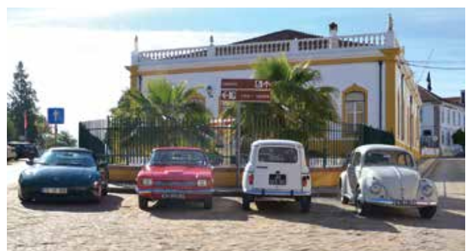
12º ENCONTRO DE AUTOMÓVEIS CLÁSSICOS E ANTIGOS