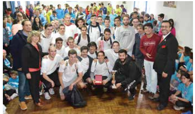
39ª ESTAFETA DA LIBERDADE | REGUENGO – SÃO MATEUS

Apoio em diversas iniciativas, nomeadamente: Grande Prémio de Atletismo, Estafeta da Liberdade, Folclore, Ténis, Futsal, Ciclismo, Encontro de Automóveis, Festival Jovem e apoio à edição de livros, Jogos do Município e Ciclo da Primavera, Run Castle, 1º Trail Cidade de Montemor, entre as muitas iniciativas levadas a cabo pelo Movimento Associativo.