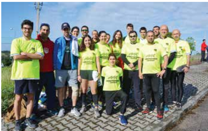
39ª ESTAFETA DA LIBERDADE | ATLÉTICO CLUBE DE MONTEMOR