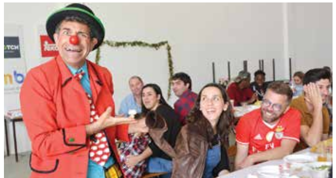
➤ CICLO DA PRIMAVERA 2019 | FAZENDAS DO CORTIÇO