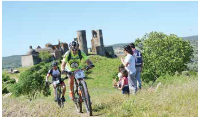
11ª MARATONA DE BTT | CIDADE DE MONTEMOR