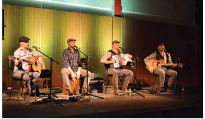
➤ CICLO DA PRIMAVERA 2019 SÃO GERALDO