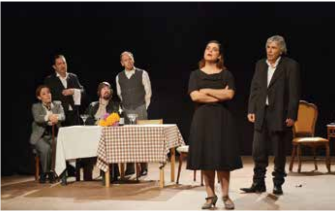
➤ CICLO DA PRIMAVERA 2019 SILVEIRAS