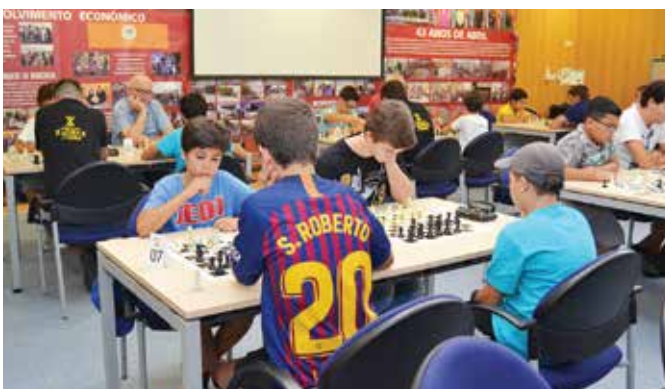
TORNEIO DE XADREZ