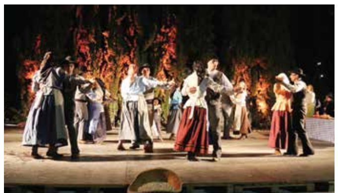
NOITE NACIONAL DE FOLCLORE | RANCHO FOLCLÓRICO E ETNOGRÁFICO MONTEMORENSE | FOTO MUNICÍPIO DE MONTEMOR