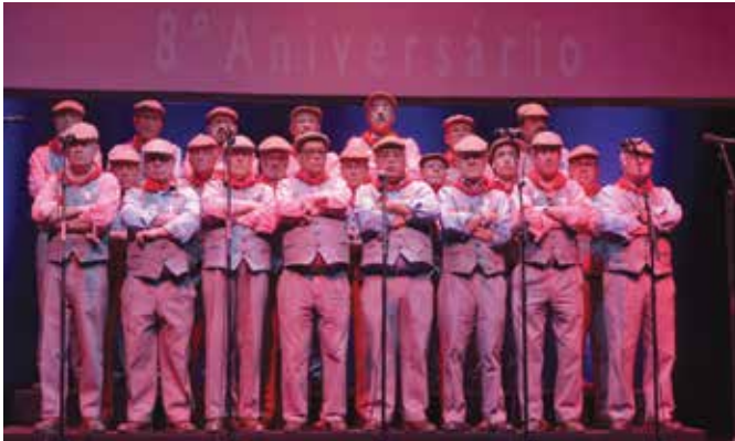
8º ANIVERSÁRIO DO GRUPO CORAL FORA D'ORAS