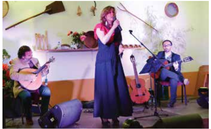
➤ CICLO DA PRIMAVERA 2019 MAIA