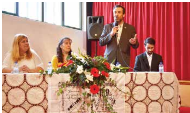
12º ANIVERSÁRIO DA ESCOLA DE MÚSICA ENSEMBLE MONTEMOR