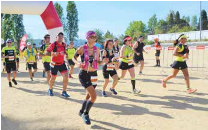
1º TRAIL MONTEMOR A CORRER