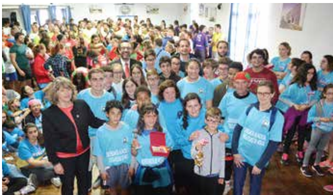
39ª ESTAFETA DA LIBERDADE | ALMANSOR FUTEBOL