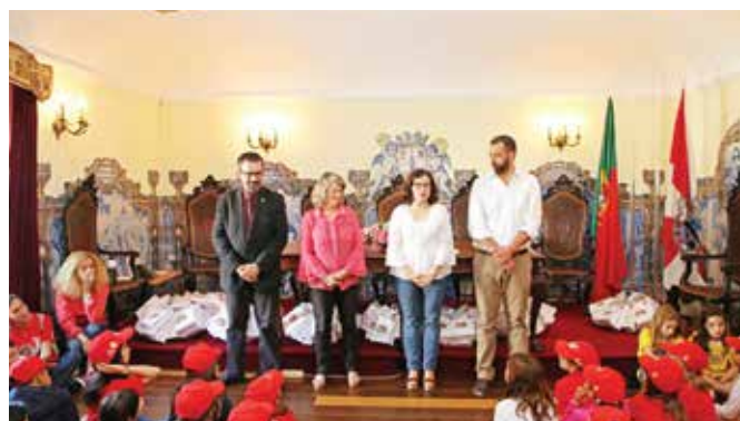
RECEÇÃO AOS ALUNOS DO PROJETO "4 CIDADES"