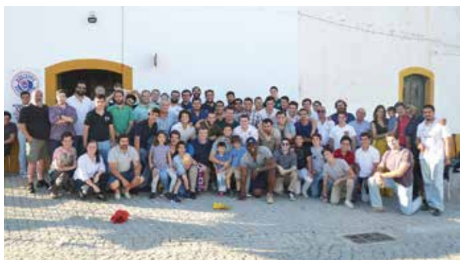
ENTREGA DAS MEDALHAS AOS CAMPEÕES NACIONAIS DE RUGBY RUGBY CLUBE DE MONTEMOR