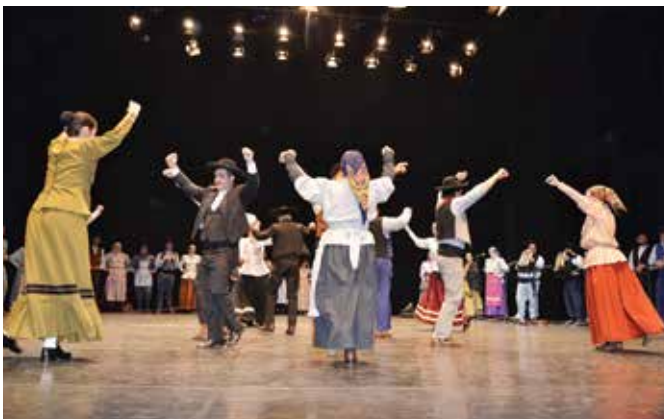
61º ANIVERSÁRIO DO RANCHO FAZENDEIROS DE MONTE-MOR-O-NOVO