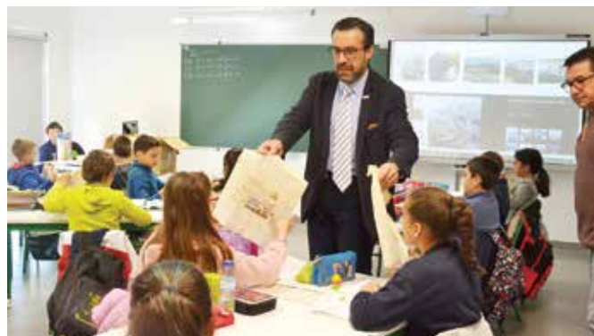
DISTRIBUIÇÃO DOS JOGOS ALUSIVOS AO PROJETO "LEMBRAR ABRIL"