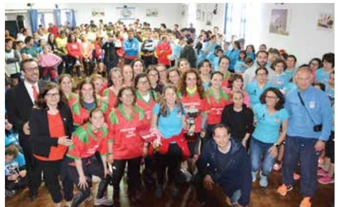
39ª ESTAFETA DA LIBERDADE | EQUIPA FEMININA