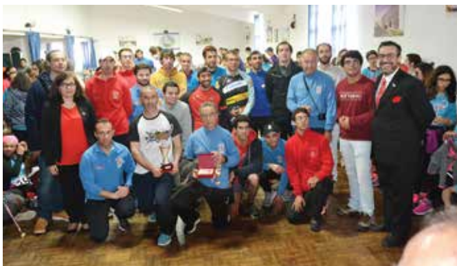
39ª ESTAFETA DA LIBERDADE | EQUIPA A BOMBEIROS