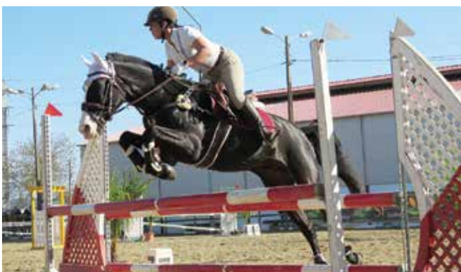
II JORNADA DE SALTOS DE OBSTÁCULOS | TROFÉU DO DISTRITO DE ÉVORA | CENTRO HÍPICO D. DUARTE