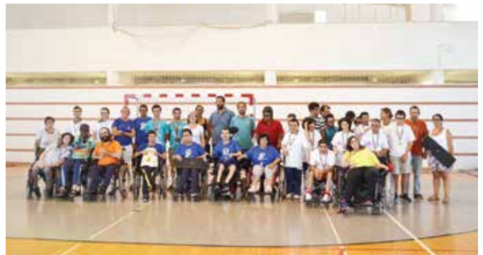
5º TORNEIO DE BOCCIA