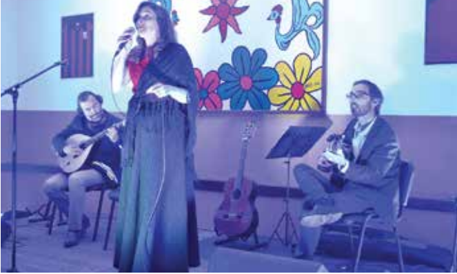
➤ CICLO DA PRIMAVERA 2019 REGUENGO | SÃO MATEUS