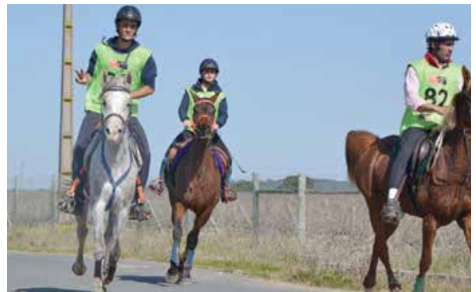
RAIDE INTERNACIONAL CEI | EQUIMOR