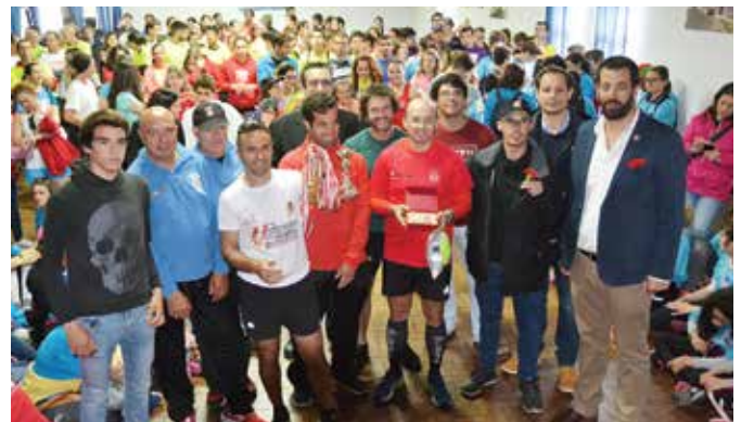
39ª ESTAFETA DA LIBERDADE | EQUIPA B BOMBEIROS