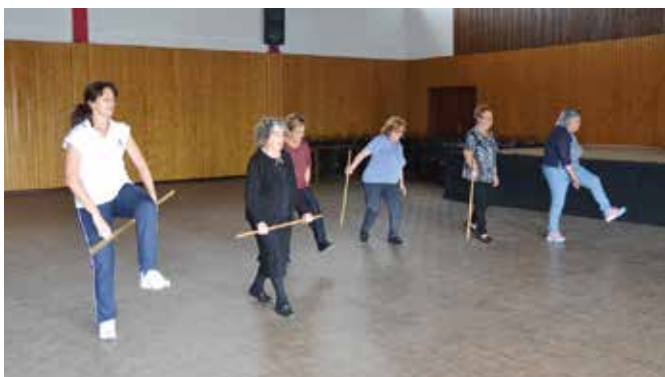
➤ ARPI DE SÃO GERALDO