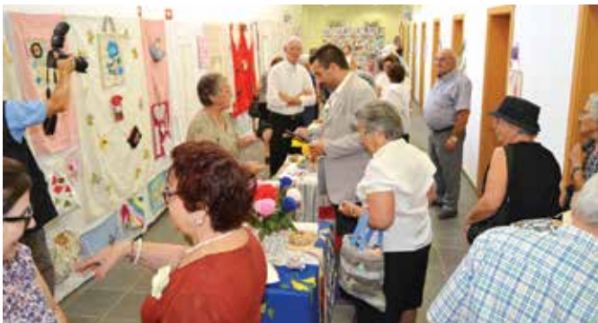
EXPOSIÇÃO DE ARTES DECORATIVAS | ARPI DE MONTEMOR-O-NOVO