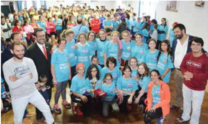
39ª ESTAFETA DA LIBERDADE | SILVEIRAS EQUIPA FEMININA