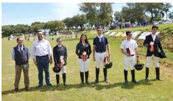
4ªS JORNADAS DE SALTO DE OBSTÁCULOS | EQUIMOR