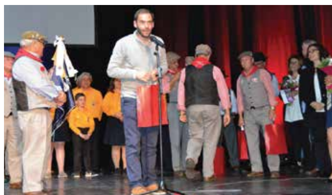
8º ANIVERSÁRIO DO GRUPO CORAL FORA D'ORAS