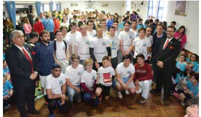
39ª ESTAFETA DA LIBERDADE | SILVEIRAS EQUIPA MASCULINA