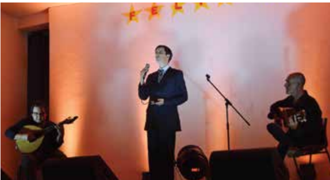
➤ CICLO DA PRIMAVERA 2019 SILVEIRAS